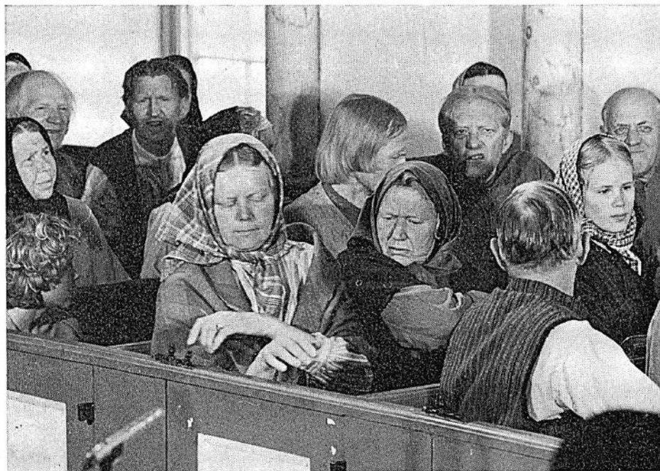
Många var druckna och klockaren sov under Peter Wieselgrens första predikan i Västerstads kyrka i Skåne år 1833. Bilden ur filmen "Peter Wieselgren — en man för folket" återger det tillfället.

denna för Sverige unika utveckling skulle kunna nå ut till skolor och föreningar i landet — och kanske ännu längre. Kanske skulle den t.o.m. kunna bli ett svenskt bidrag till en utveckling som den indiske journalisten hade önskat sig för sitt land och många länder i den tredje världen.