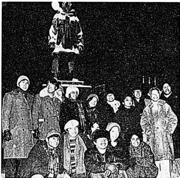
Grupp ur Song of Asia framför Roald Amundsens staty i Tromsø.

— Efteråt kan jag tycka att det hela var onödigt. Jag ser