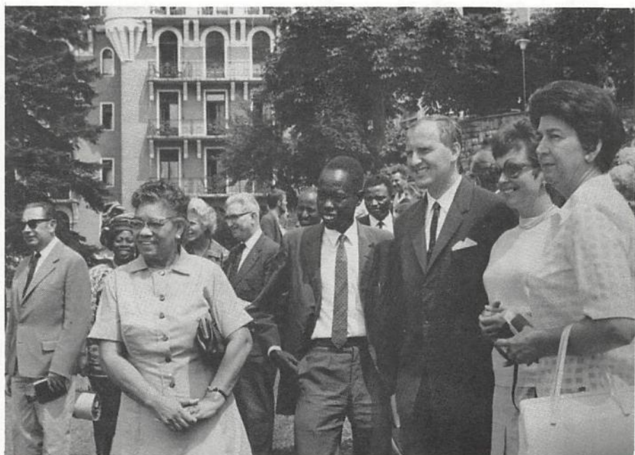
Lärare från fem kontinenter på konferens i Caux