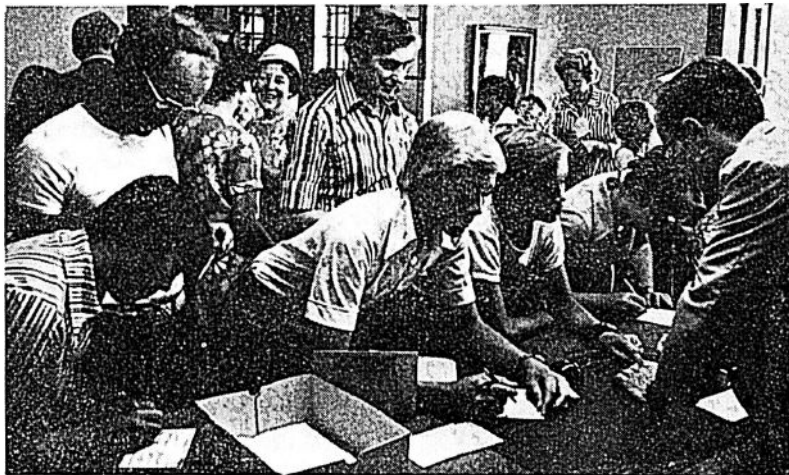
42 vastgotar anlander till Caux dar de bli presenterade Varnhemsspelet Ett flertal familjer ingick i denna grupp

Från Citeaux i sodra Frank- rike utvandrade en del cister- ciensermunkar till Sverige på 1100-talet, sanda av Bernhard av Clairvaux De grundade klos- tret i Varnhem Vastergotland