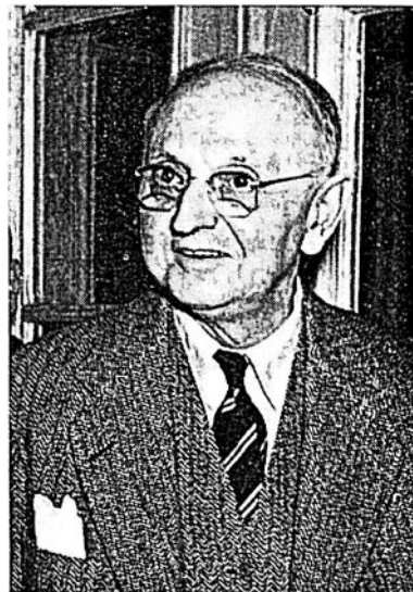
Dr Frank Buchman

«Kampen för Amerika är kampen för Amerikas själ — Amerika måste upptacka sin rättmatiga ideologi som har sitt ursprung i dess kristna arv och som är dess enda verkliga