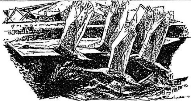
Nordens fem svanar — litografi av Lennart Segerstråle