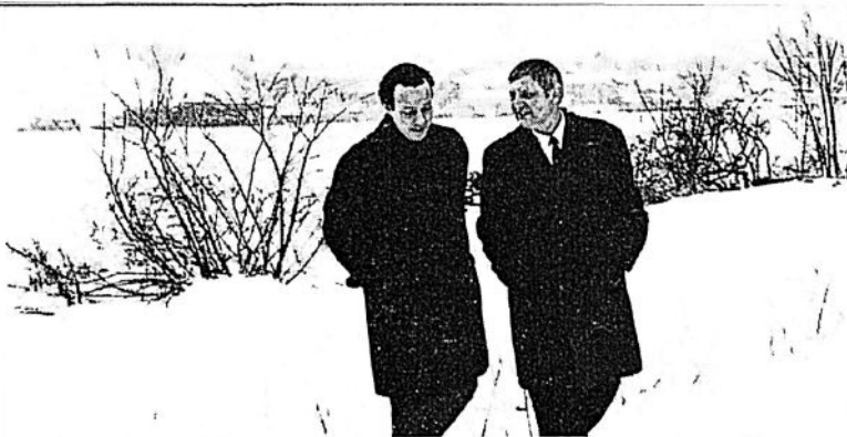
På stockholmspromenad under Sverigebesöket

talat utifrån smartsam erfarenhet min egen dotter började med knark och var försvunnen i 1 1/2 år. Nu har hon genomgått en avvänjningskur och skall börja läsa sig ett yrke.