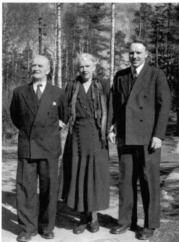
Forfatteren med sine foreldre som var viktige for hans livs- valg.