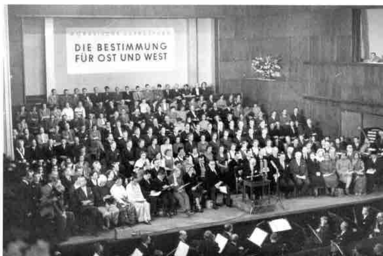
Et møte med tema: «Bestemmelsen for Øst og Vest» samlet tusener av mennesker i Gelsenkirchen.