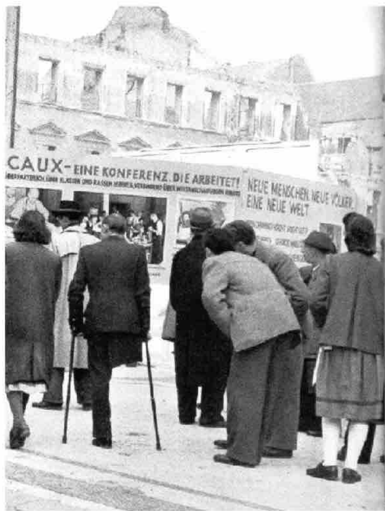
En internasjonal gruppe fra Moralsk Opprustning dro gjennom det krigsherjede Tyskland med sitt budskap: «Nye mennesker, nye nasjoner, en ny verden».