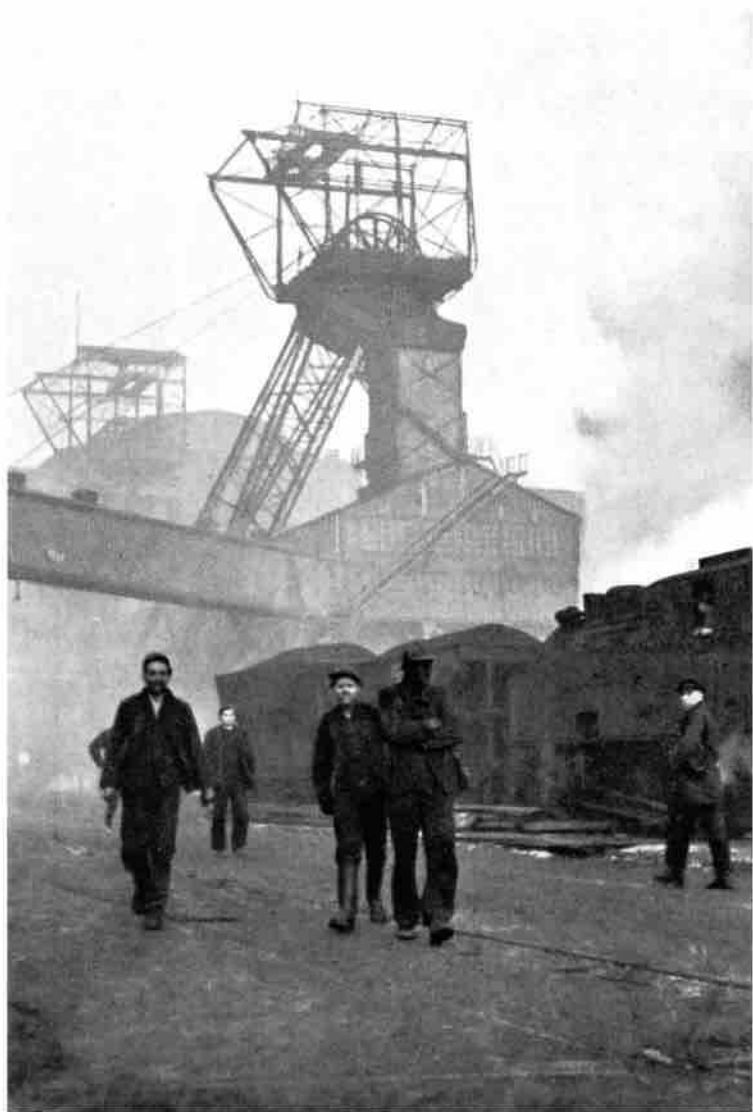
Kullgruvedriften i Ruhr-området var en av etterkrigstidens viktigste ideologiske kampplasser.