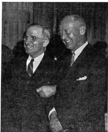
Harry S. Truman och James W. Wadsworth vid premiären i Philadelphia

I Montreal Stars ledare heter det: "Det mest betydelsefulla med "Den glömda faktorn" är, att den på ett fångslande och överbevisande sätt visar ett alternativ till klass- och raskamp. Den kommer att mottagas med intresse av alla sunt tänkande medborgare