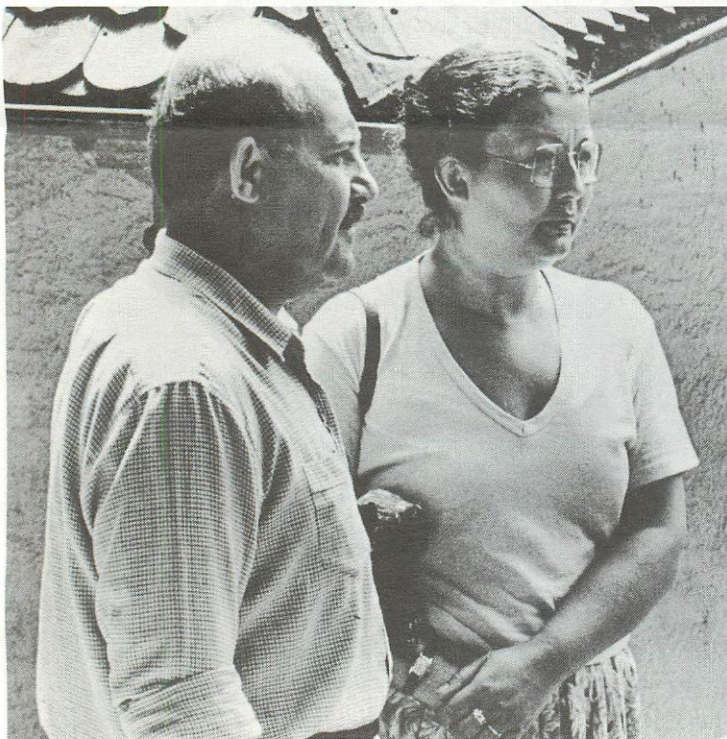
Das Ehepaar Andaç

Ganz allgemein war in der türkischen Bevölkerung immer eine bestimmte Liebe für die Deutschen vorhanden, und neben wirtschaftlichen Gründen war dies sicher ein Anlass dafür, dass Türken besonders gern nach Deutschland kamen.