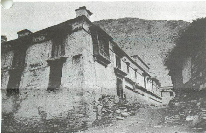
Sangling im Südosten Tibets, die Heimatstadt Tsering Dorjees. Im Hintergrund sein Elternhaus.

1959 kamen etwa 80000 Tibeter nach Indien, Nepal und Bhutan. Der Flüchtlingsstrom dauerte bis in die sechziger Jahre an, weil die Lage in Tibet untragbar war. Ausserhalb Asiens hat die Schweiz die grösste Anzahl, etwas über 1400 Tibeter aufgenommen. Ich wurde in Tibet geboren und floh 1959 als Achtjähriger mit meinen Eltern. Wir flohen nach Nagaland (ein Teilstaat Indiens, Anm. der Red.). Das war die schwierigste Route; sie führte mitten durch gefährlichen Urwald. Wenn ich mich recht erinnere, waren wir vier oder fünf Monate zu Fuss unterwegs bis zur indischen Grenze.