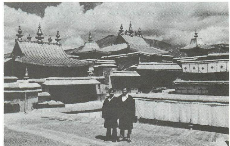
Lhasa. Eine Aufnahme aus dem Jahr 1980.

Ich habe keine Beschwerden. Natürlich hat ein Flüchtling viele Probleme, aber diese wurden nicht vom Gastland geschaffen.