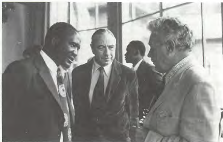
Quelques-uns des délégués rhodésiens.

der, est totalement multiraciale mais, à cause de l'attitude de Blancs comme lui-même, n'a pas tiré parti de toutes les possibilités qui sont les siennes. « Je ne faisais aucun effort réel pour connaître mes collègues africains », a-t-il précisé.