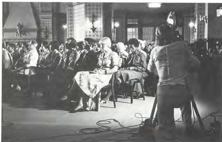
Une caméra de la Télévision suisse allemande au travail pendant une réunion plénière à Caux.