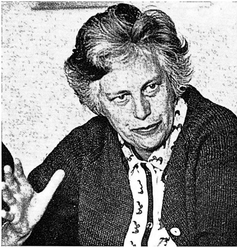
Karin Moberger Ytterst är det fråga om lärarnas livskvalitet

Man ser t ex hur enskilda människors moraliska beslut och religiösa upplevelser har förändrat historiens gång Samtidigt ger upptäckten av det allmanskliga en vidgad känsla hos eleven för människor i hela världen