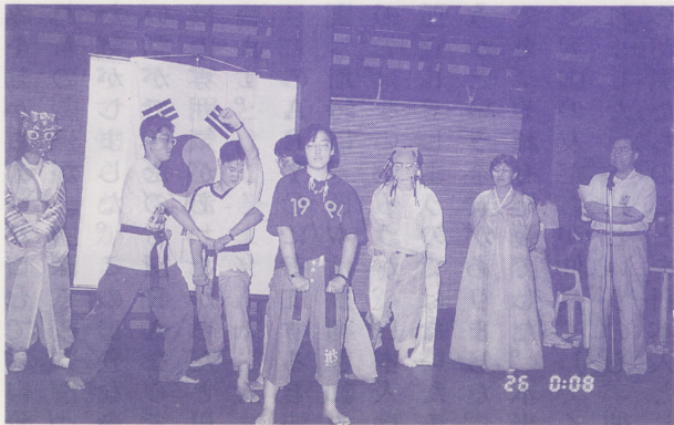
●文化のタペでテッコンドーや仮面踊りを披露する韓国代表