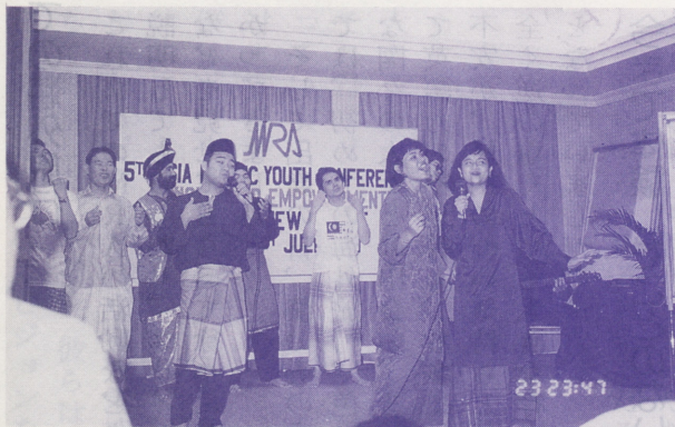
●多様な民族・文化を有する自国を歌と踊りで紹介するマレーシアの参加者達

界にひたっていた自分を反省させられました。そして、命を賭ける位に真剣で真面目な彼らの生き方に尊敬の念さえ抱きました。また、フィリピンの参加者は、「ある日突然、政変のために、それまでの幸せだった家庭が一瞬にして財産を失い、学校もやめて働かなければならない苦しい生活が始まった。その不幸を招いた政府を憎むことしか頭の中になかったことがさらに不幸を呼んだ。その間違いに気付きそれを正した時に自分が生まれ変わって幸せな生活に戻ること