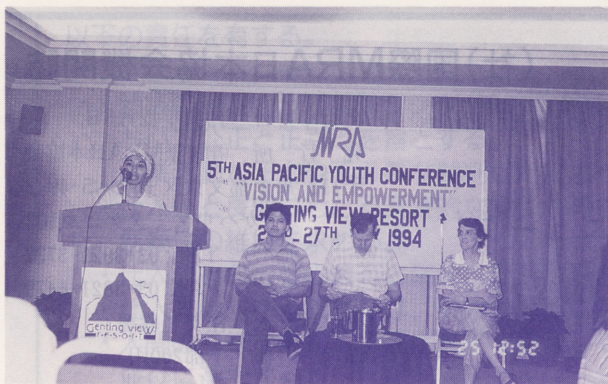
●全体会議でも個人の体験が率直に語られた（発言者はマレーシアの女性）