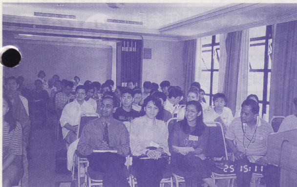
●アジア・太平洋地域の多様性を示す顔が並ぶ

くれた時も、お礼の言葉も言わず、父のために用意しておいたプレゼントもとうとう渡しませんでした。ところが今年、父が突然心臓マヒで亡くなってしまったのです。お礼の言葉も言わなかった自分が本当に悔やまれました。やるべきと思ったことは、決して明日に延ばしてはいけなくと学びました」と涙ながらに語ると、カンボジアからの参加者は、「自分の家族はポルポト時代に一人の兄を除いて全員殺されました。兄は私にだけは教育を受けさせようと日夜一所