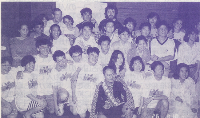
●すっかり仲良くなった参加者たち(前列中央は台湾の山岳少数民族の代表)