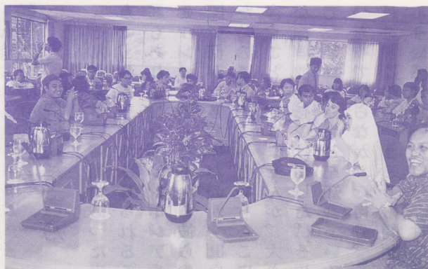
●マレーシア戦略問題研究所でも活発な質疑応答がなされた

会議の他にも、マレーシア戦略問題研究所を訪ねて、マレーシアの二千二十年に向けてのプロジェクトプランについての説明を受けたり、マレーシアの特产品であるバティックやピューター（錫製品）の工場を見学しました。又、北部の有名なりゾート地であるペナンに向かう途