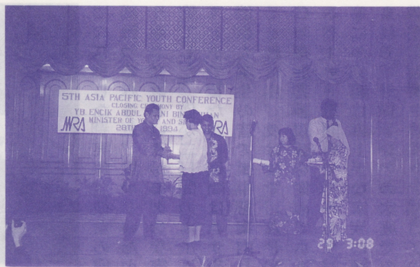
●ガニア・スポーツ・青年大臣から参加証が各国代表に手渡された

っと自国について学んでいくつもりです」と語りました。又、丁度、留学先のエジプトから帰国してこの会議に出席できたマレーシア人参加者は、「九年前、学校の担任の先生の指示で、級友たちに本を貸し出しました。一年後、回収した時、何冊か足らなかつたのですが、先生がそれに気付かなかつたことをいいことに、そのままになっていました。この会議に参加しているうちに、そのことを思い出しました。エジプトに戻る前にその学校の校長先生を訪ねて謝るつもりです」と述べた。又、韓国人参加者は、「この会議に参加する前、私はいつも物事を否定的に捉えがちでしたが、それが変わりました。以前仲が良かったグループが分裂してしまつた時、彼らを仲直りさせる勇気がありませんでした。帰国したら、その友人たちに謝る決心をしました」と述べた。青年たちの決心を聞き終えたガニア大臣は、大変感激した旨をその講演の中で繰り返し述べました。