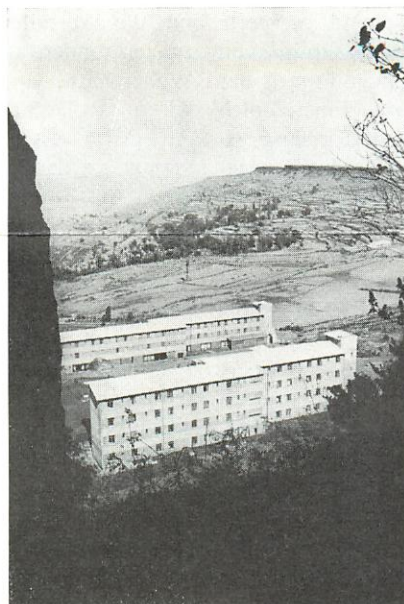
Asia Plateau Panchgani

etwas Besseres, Stärkeres als Gewalt? Ihnen erzählt Joseph Zokunga seine Geschichte. Er kommt aus Assam, dem nordöstlichsten Gebiet Indiens, dem Vorposten an Chinas Grenze. Dort kämpfte eine 10000 Mann starke Untergrundarmee für die nationale Unabhängigkeit ihres Territoriums gegen die indische Armee. Bittere Entschlossenheit und Grausamkeit auf beiden Seiten. Joseph erzählt: «Wenn ein Offizier der Untergrundarmee zu seinen Leuten sagt: Ich brauche zwanzig Männer, bereit, jetzt zu sterben! wer-