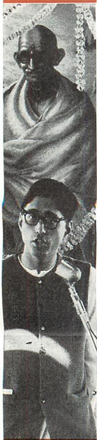
von Rajmohan Gandhi

Die vierundzwanzig Jahre, seit Indien frei ist, werden oft als kurze Zeitspanne bezeichnet. Drei weitere kurze Zeitspannen, und wir werden hundert Jahre frei gewesen sein.