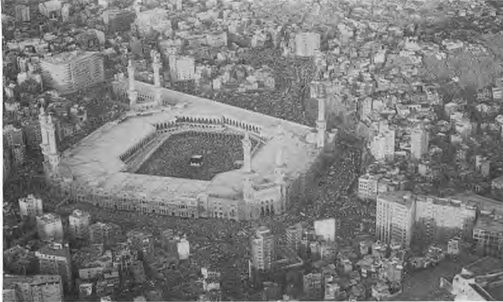
Ci-contre: une vue de la Mecque. Ci-dessous, des versets du Coran dans une édition ancienne.

s'ouvrir sur des préoccupations concernant l'avenir de leur société. Les acquis fantastiques de l'époque moderne ne donnent pas forcément un sens à la vie. Le libéralisme économique montre ses limites chaque fois que le profit devient le maître absolu. Malgré un système social que beaucoup nous envient, les grèves