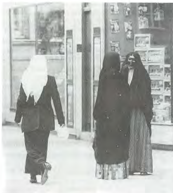
Ils craignent qu'intégration signifie assimilation.

Je reconnais cette tendance en moi-même. Je respecte le musulman qui