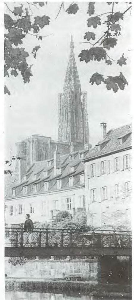
A Strasbourg, symbole de réconciliation, un dialogue en profondeur.

qui ont le sentiment de ne pas être reconnus par la société française comme ils le voudraient. Ils souffrent de l'image d'un Islam redoutable dont, parfois, on fait d'eux les porteurs. Ils craignent que l'intégration ne signifie en fait assimilation, c'est-à-dire qu'il aient à renier leur identité musulmane.