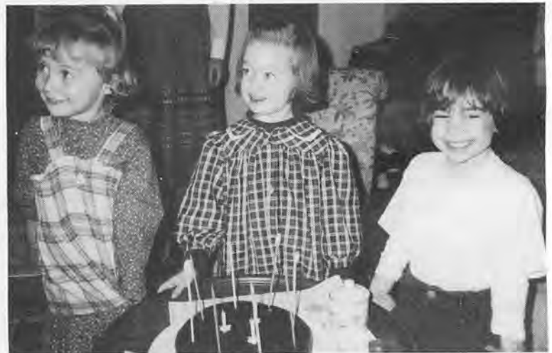
Le désir de l'enfant: ni le dévaloriser, ni y céder.

Sur un autre registre, si un enfant réclame un jouet hors de saison, Françoise Dolto préconise aussi le dialogue: oui, ce jouet est intéressant, on pourra entrer dans le magasin, le regarder et peut-être le toucher, mais on ne pourra pas l'acheter. En revanche, on pourra en parler, le