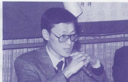
韓国人の日本人に対する一般的な見方と自分が日本に望むこと

徳太子の昔からあり、概ね友好的であったのですが、豊臣秀吉の朝鮮出兵、そして伊藤博文や福沢諭吉の時代にも色々とあつて関係が悪化しました。今日に至っても歴史的な感情が韓国には残っており、韓国人の反日感情にはそういう歴史的な背景が相当あるのです。