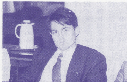
外国人は日本で働けるか? 日本企業で働く外国人の視点

めても将来出世する見込がないという理由で会社を辞めてしまったというような話を聞くことが少なくありません。国際化を図る日本企業としては、日本語が出来、人脈や知識を持つ外国人に二、三年で辞められてしまつては大変困ることでしょう。それではなぜ外国人が日本企業で長続きしないのか少々説明してみたいと思います。