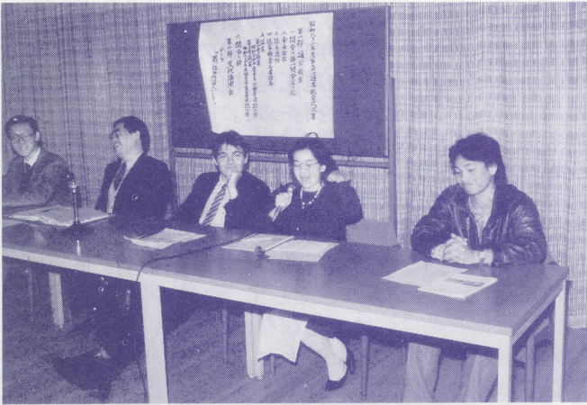
●総会第二部MRAミニ・シンポジウム「若い在外日本人から見たニッポン」より