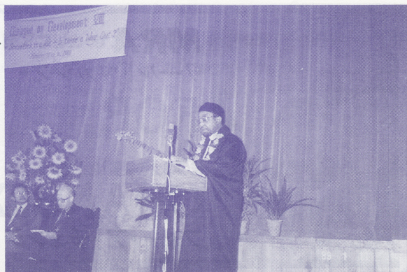
●開会式で挨拶するナイジェリア回教徒の指導者の一人、アルハジ・アド・バエロ王子

私たちの身辺にある「轍」にはどのようなものがあるのだろうか。アジア、アフリカ各地で、宗教と部族