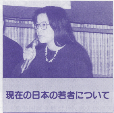
現在の日本の若者について

私が今まで接してきた日本の若者は「国家」というものに対する意識が余りにも欠けていると思うのです。現在の日本の若者は一度も戦争という厳しい環境に置かれたことがありません。欲しいものはすぐ手にはいるし、外国に行きたければアルバイトをすればすぐに行けるような恵まれた環境の中で、最近、自分さえよければそれで良いという考えの人が増えてきました。自分の国を愛せない限り、他の国を愛することは出来ないと思います。自分の両親、親戚を大切にしない人が他の人を大切にすることも出来ません。うわべだけ、口先だけでは本当に愛することは出来ません。