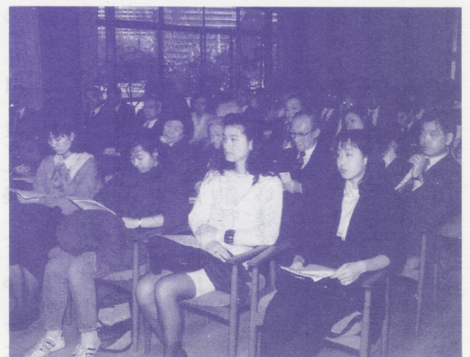
●熱心に聴き入る日本の若者達

情を大切にして祖国の再建に協力できるよう頑張りたいと思います。日本も是非心の通ったリーダーシップを発揮して頂きたいと思えます。