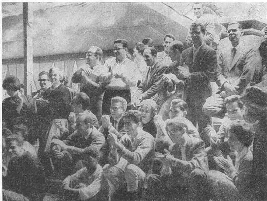
Avec les étudiants en droit de l'Université catholique de Sao Paulo

● Un prêtre missionnaire affirma après avoir vu Le Tigre : « C'est inspiré par Dieu. C'est là le travail de l'Esprit-Saint. C'est une idéologie qui se place au-dessus de toutes les organisations pour transmettre aux hommes la force divine. C'est le début de la victoire de Jésus-Christ dans le monde. Voici l'apostolat de Christ pour notre époque. »