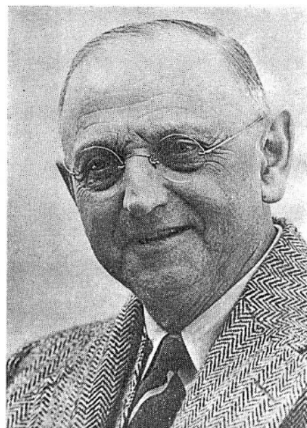
Frank Buchman, född 4 juni 1878 i Pennsylvania, USA, död 17 aug. 1961 i Freudenstadt, Västtyskland.

Buchman hade teologisk utbildning och verkade först som socialarbetare, studentpräst och missionär. Hans trosgrund var evangelisk kristendom men hans världsomsännande livsförvandlings- och försoningsinsats kom att bli ekumenisk i en dimension som föregriper en ny epok i religions-