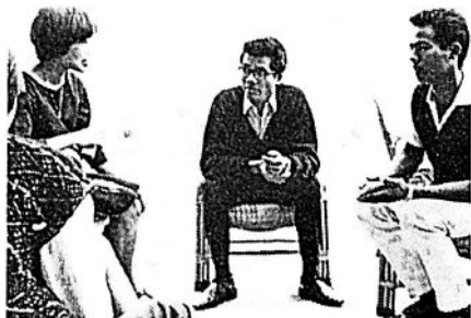
Ungdomsdelegater från Mizo området i Assam, delstaten i nordöstra Indien, kom med en stor grupp till Panchgani