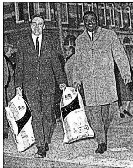
Gåvor in natura strömmar hela tiden in till Westminster-teaterns kulturcentrum från olika delar av England

Dessa ungdomar har inte nojt sig med att vanta på publiken i teatern, aven om den roda lampan for «ut-