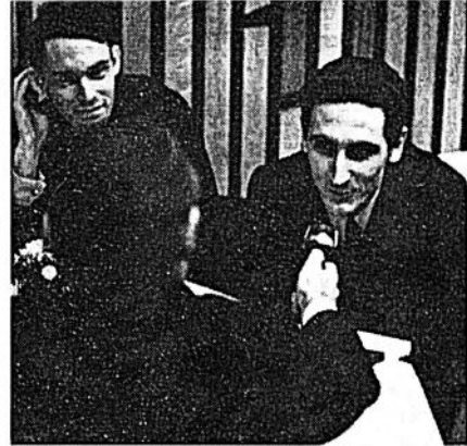
En osteuropeisk radioreporter intervjuar några av ungdomarna Har utfrågats parisiske skådespelaren Michel Orphelin