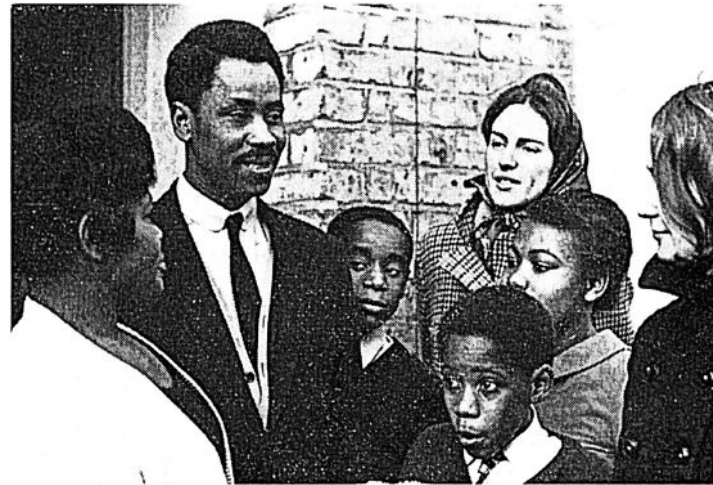
Familjen Williams i en av Londons förstäder var en av de familjer som tog emot ungdomar ur den internationella truppen.