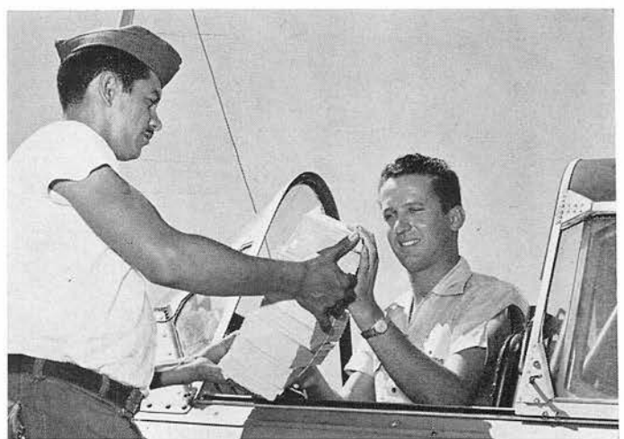
l'imprimerie Roto-Sadag à Genève en direction du continent sud-américain. A droite: Selon les directives du commandant de la base aérienne, la ville de Fortaleza a été «bombardée» de 100 000 tracts annonçant l'arrivée du maréchal Tavora et de la pièce japonaise. On voit ici le chargement du matériel.