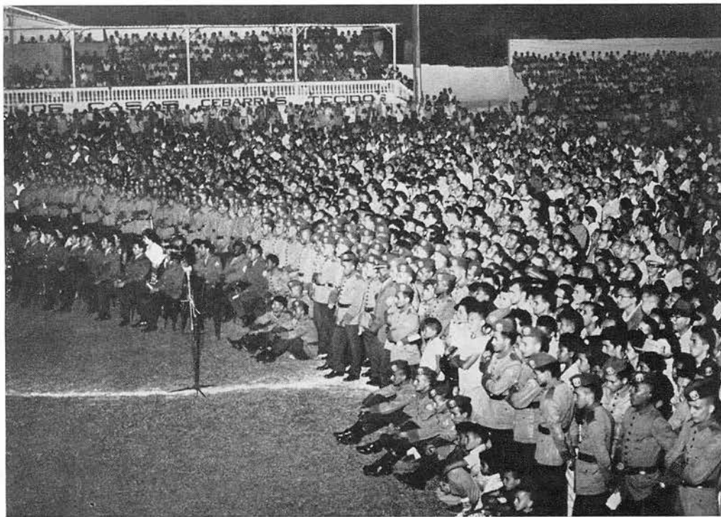
NATAL: Pour rencontrer le Réarmement moral, 40 000 civils et militaires ont envahi le stade de football, construit pour contenir 7000 spectateurs!

Ce qui préoccupe ces hommes, c'est avant tout l'infiltration communiste.