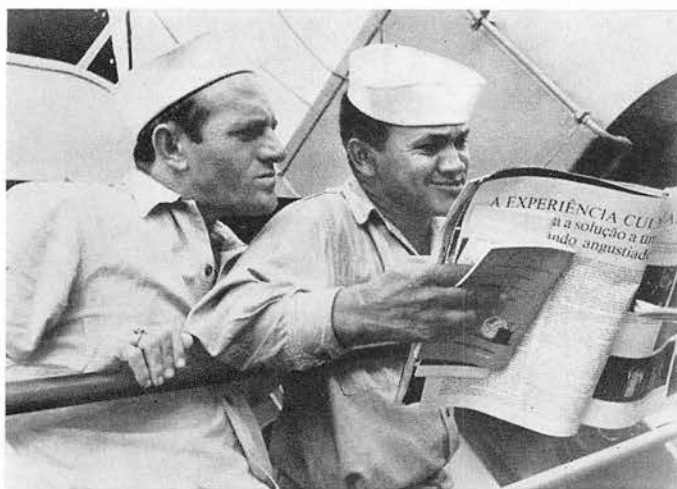
A gauche: A bord d'une des corvettes affrétées par la marine brésilienne pour le transport de la délégation internationale, la revue du Réarmement moral devient la lecture des marins. Paraissant en 26 langues, le dernier numéro de cet illustré a été conçu spécialement pour appuyer l'offensive en Amérique latine. 500 000 exemplaires en portugais et 500 000 en espagnol ont quitté

Au stade, le général Vasco a ouvert la manifestation en faisant défiler