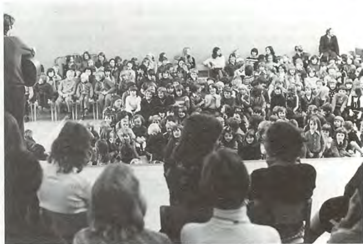
Instantanés de la tournée qu'a faite en Ecosse une jeune équipe internationale du Réarmement moral. A gauche : visite du chantier naval Scott Lithgow à Port Glasgow. A droite, chants et sketches dans une école d'Aviemore.