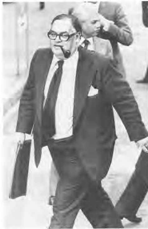
L'ambassadeur britannique Ivor Richard, président de la conférence : « Un miracle est requis. »

26 octobre. Petit déjeuner avec l'un des collaborateurs de l'évêque Muzorewa. Il est encore sous le coup de la manifestation de