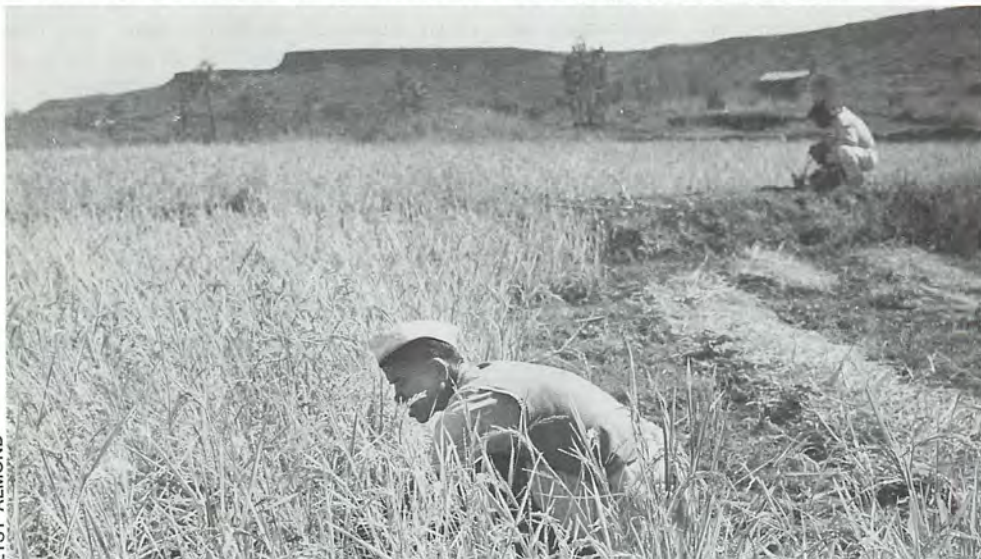
La première récolte de riz dans une terre considérée jusqu'alors comme inculte