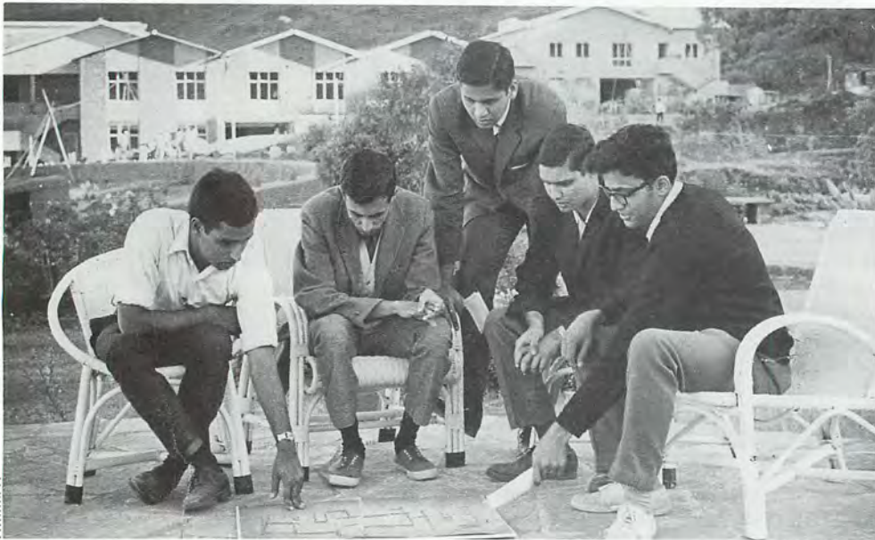
Le centre de formation « Plateau d'Asie » à Panchgani