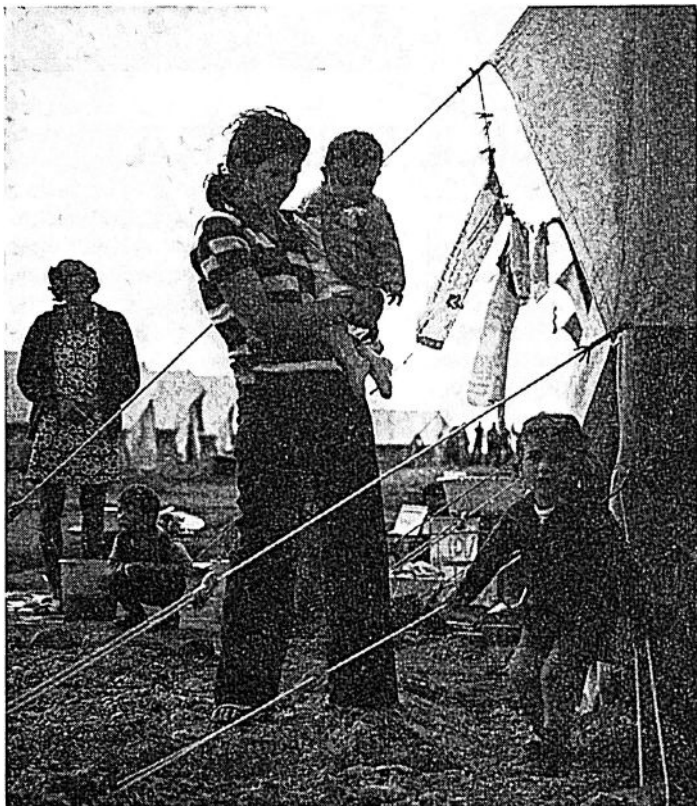
Flyktinglager på Cypern

Hans måg, som är soldat, har anmälts som saknad men familjen bevarar hoppet att han lever och gommer sig i bergen, ett hopp som delas av alla anhöriga till de tre tusen män av vilka man förlorat alla spår.