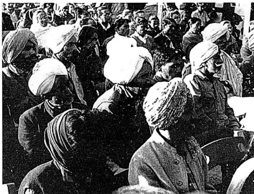
Några av Shillongs kastlösa koloni under en mottagning för gästerna från 14 länder i Assams huvudstad.

Olika ledare i staten uttryckte under konferensens lopp en växande övertygelse att ett samförstånd mellan de olika befolknings-elementen i Assam är möjligt. Parlamentets ställföreträdande oppo-