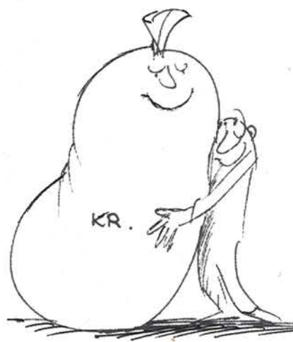
... flere blir styrtrike

Mine forfedre og formødre kom alle fra Vestfold, men jeg vokste opp i Oslo, ikke langt fra Bislett. Vi bodde i en leiegård, i femte etasje, uten heis. To ganger i uken vandret en bonde opp alle trappe- ne og satte fra seg et spann med melk utenfor vår kjøkkendør. Og hver morgen kl. 7 lå dagens avis på dørmatten. I 1925 lå gjennomsnittslønnen på 1 krone og 71 øre.