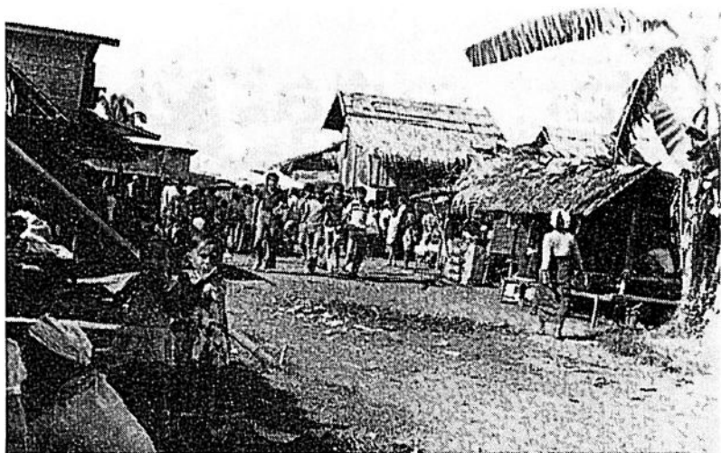
Ingången till marknadsplatsen i det flyktinglager, som Genis mamma är förståndare för

När de kom till gerillans gomatställe, valkomnades de av 140 personer som vantade på dem De stannade sex dagar och nätter och diskuterade med gerillan om vad som hant i vår familj De utmanade dem att överväga den sorts förändring i människans hjarta som kan leda till