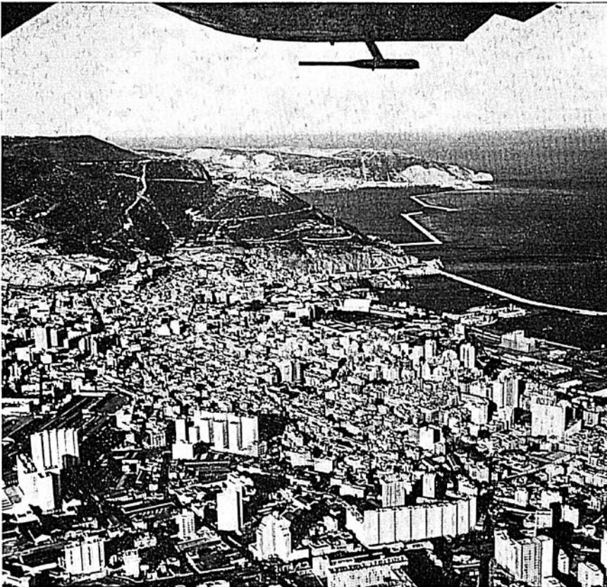
Oran 1962. Ett flygfoto taget av författaren under en rekognoseringstur av provinshuvudstaden och hamnen.