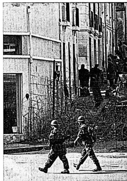
Taggrådsbarrikad på en av Orans gator och ett europeiskt område

Samma månad fick jag brev från en god vän, som var på en påskkonferens för Moralisk upprustning i Strassbourg. Han gav mig nyheter om konferensen och frågade mig om jag inte kunde göra något för Algeriet. Jag förde då befälet över en flygplans- och helikopterkontingent i La Senia-området nära Oran. Jag hade ingenting med politik att göra. Min fru hade rest tillbaka till Frankrike en månad tidigare, och jag såg ingen utväg ur den pågående konflikten. Detta skrev jag till min vän. Han skrev genast till-