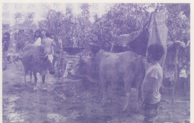
●ベトナム軍の急襲を逃れてきたサンローチャガンのカンボジア難民(1984年5月)