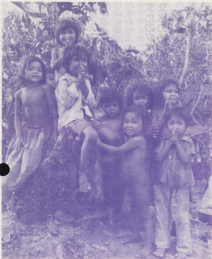
●サンローチャガンのカンボジア難民の子供たち (1984年)