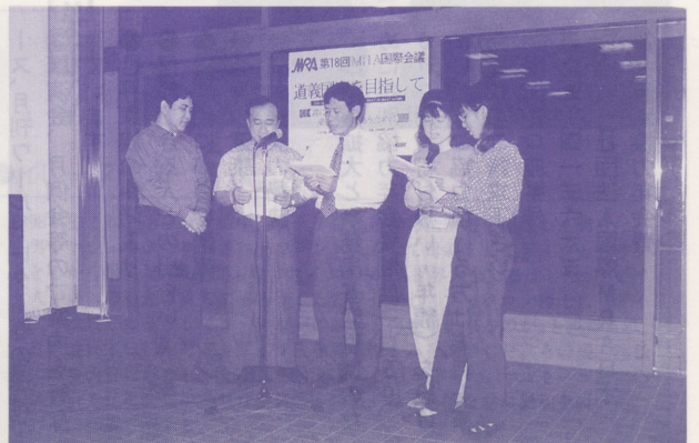
●日本人の応援を得て文化の夕べで歌を披露するミャンマー人参加者たち