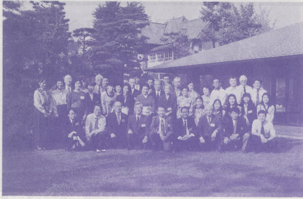
●関西秋季大会の参加者一同（住友金属工業住吉研修所）

現在、世界の人口は56億6千万人ですが、2025年には85億、2050年とは100億に増えると予測されています。これだけの数の人々が平和裡に幸せな時代を共に築いていくためには相当な努力を必要とします。つまり、今回の会議のテーマである『道義国家』を指して、共に生き、幸せを分かちあう心を高めていく以外に人類が21世紀を生き抜くすべはないのです。そのため、食糧、環境、気候、資源などの問題を考えて