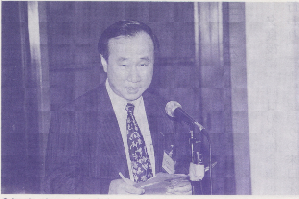
●キョウ・ウイン・トン氏（ミャンマー）

ョウ・ウイン・トン氏がミャンマーの現況、そして民主主義の大切さについて次のように語りました。