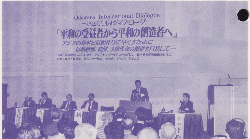
●小田原国際ダイアローグ