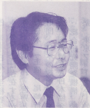
●この記事は平成6年5月例会での講演に加筆・修正を加えたものです。