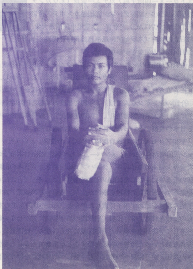
●地雷で足を失ったカンボジア難民 (カオイダン・1984年)

「ボル・ポト軍に家族が殺された人は手を挙げて下さい」と言うのと、ほとんど全員が手を挙げました。「ベトナム軍に家族を殺