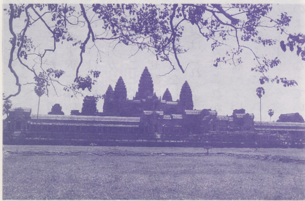
●アンコールワット遺跡

ると思います。私の考えでは、カンボジアは現代の政治の生け贄のようなものです。しかしながら私はカンボジア人の心の中に刻み込まれている、あんな思いは二度としたくない、こんな世界は嫌だという思いの上に、本当の援助というか、希望の道を示すことができるのではないかという思いも捨てておりません。それは同時に、歴史というものに対する私の懐疑への救いの道でもあるような気がします。