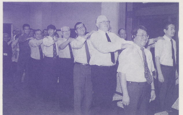
●会議の合間のリラックスタイム

一夜開けた十月九日、朝食後、三つのグループに分かれて『日本をこう変えたい』——私の日本改革のアイデア』というテーマで、一回目の分科会が行われ、それぞれ活発な対話が行われました。昼食後、小田原国際ダイアローグ『平和の受益者』から平和の