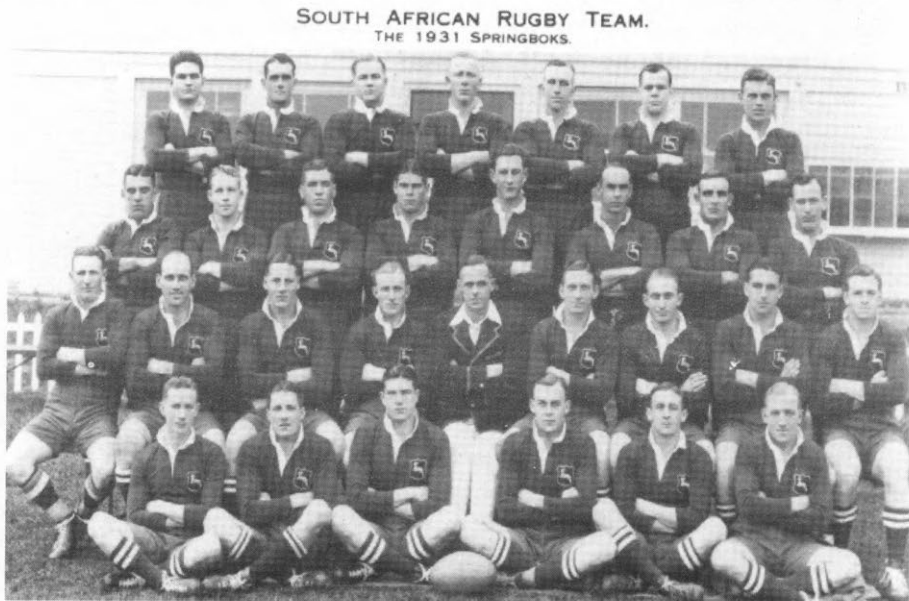
1931 Springbok-toer na Groot-Brittanje.