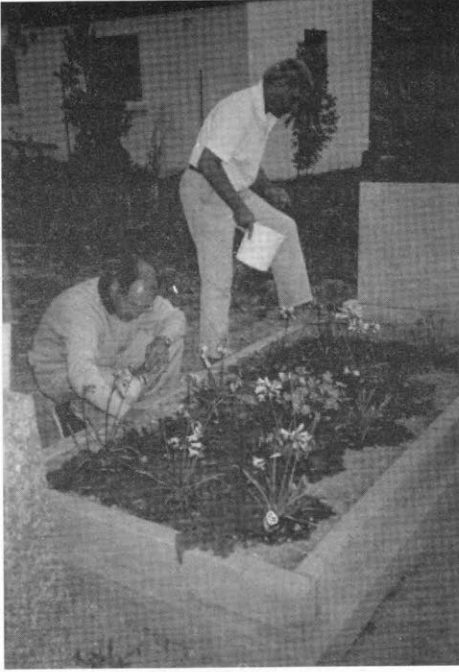
Joey se graf op Franschoek.

1ste Maart was ek weer terug op Franschoek.