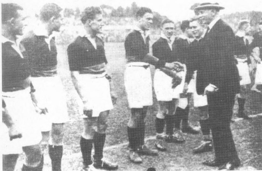
Die goewerneur generaal, Graaf van Athlone, groet die spelers.

My rugbyloopbaan het eintlik op Stellenbosch begin. Dit het so gekom. In 1916 toe moeder oorlede is en vader besluit het om my ouer broer en myself na Stellenbosch te stuur om daar by my ouma te bly, is ons na die Hoër Jongenskool, waar Paul Roos in daardie dae prinsipaal was. Daar het ek toe, vir die hele tyd wat ons daar was, in die onder-15 span gespeel, totdat