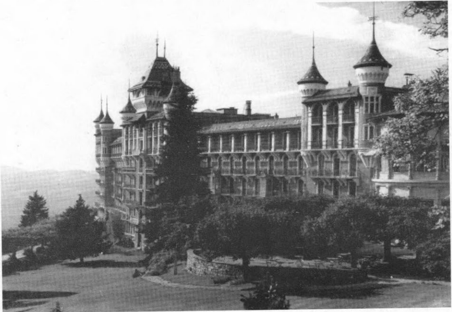
Caux Palace Hotel, Switserland, wat die hoofkwartiere van Morele Herbewing is.