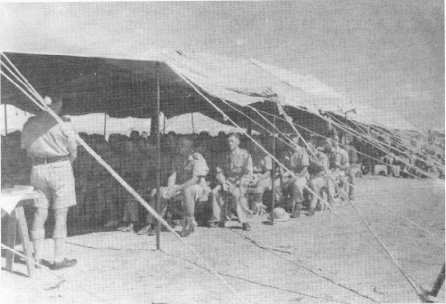
Nagmaal tydens die 2de Wêreldoorlog in Noord-Afrika.

2de Divisie so verswak dat, toe die Duitsers later Tobruk aangeval het, die hele divisie na moedige weerstand, gevange geneem is. Gelukkig was ek 'n kapelaan van die brigade wat na die 1ste Divisie oorgeplaas is en het ek gevolglik die neerlaag by Tobruk vrygespring.