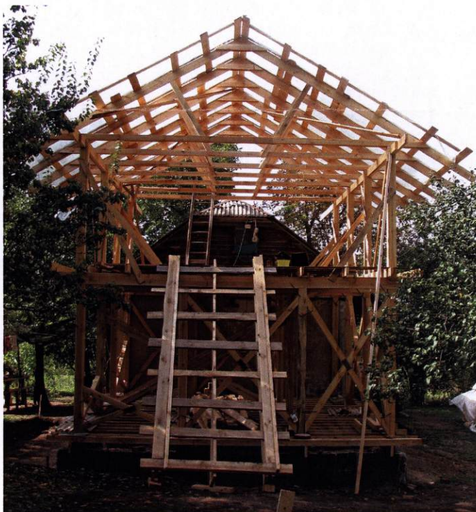
Ukraina: Et hus som kan forvandle mennesker.